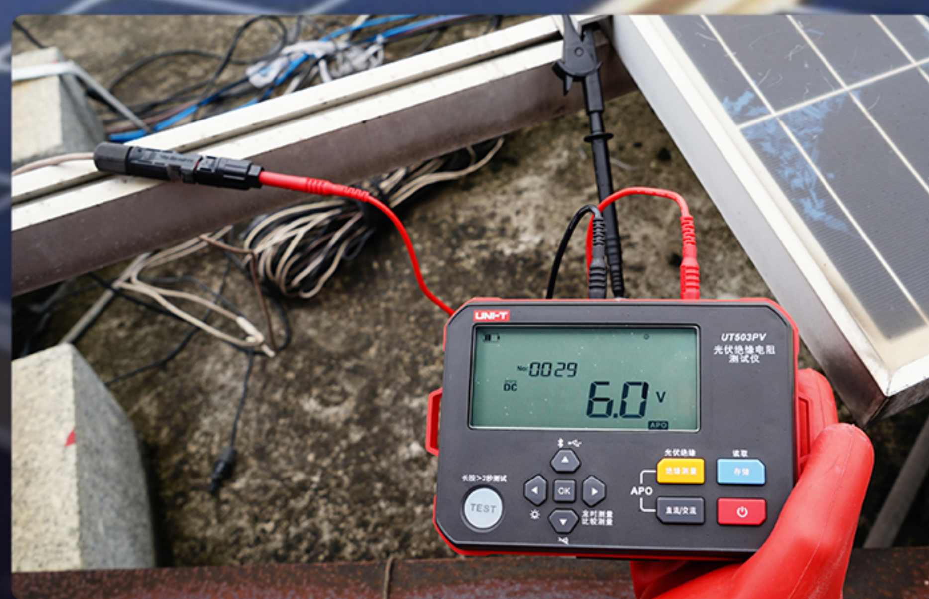
光伏组件接地电压测量