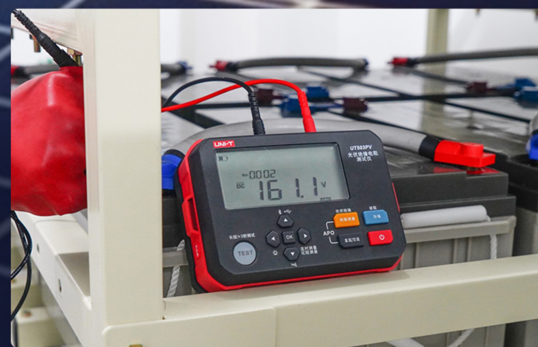
蓄电池直流电压测量