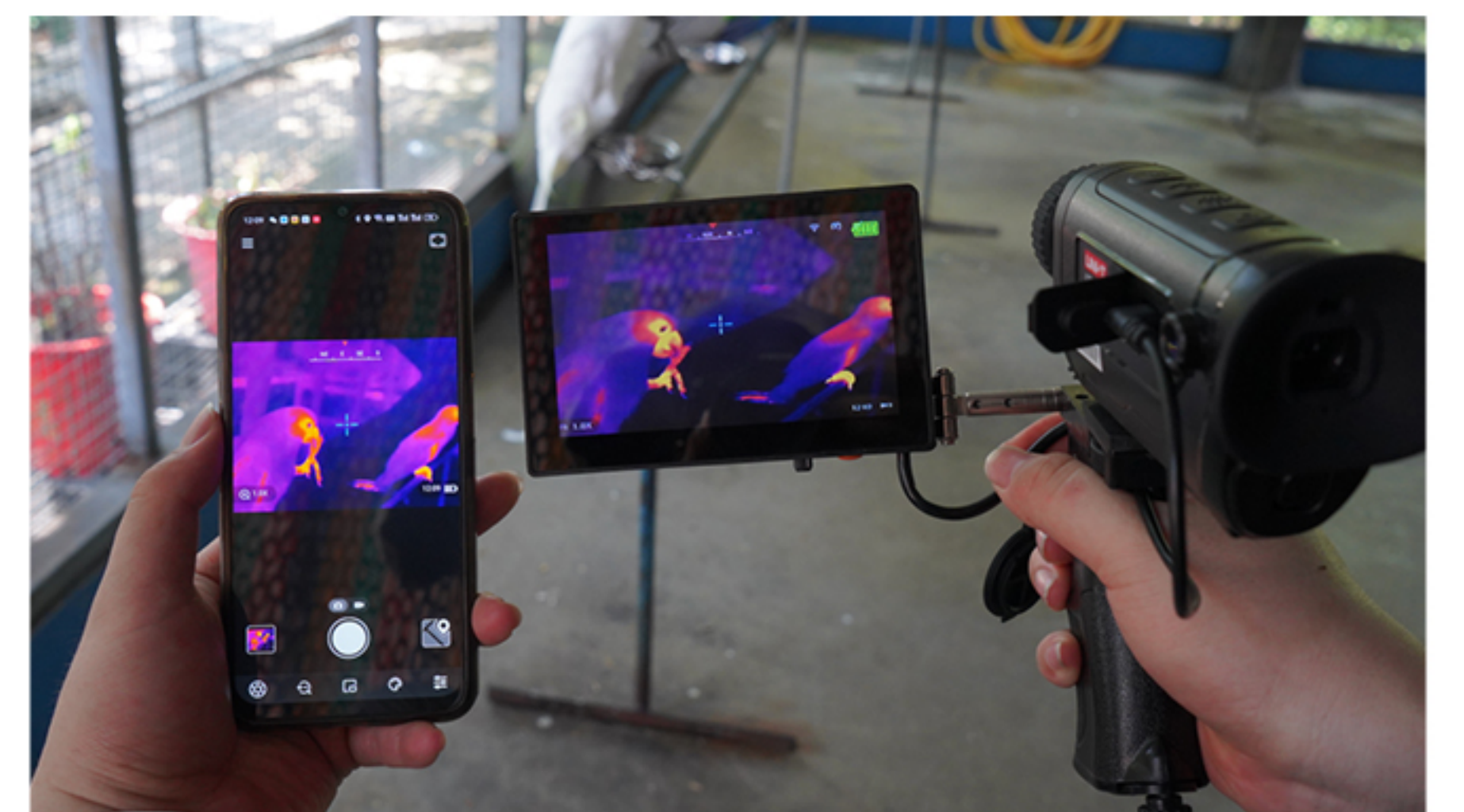
手机 APP 实时视频